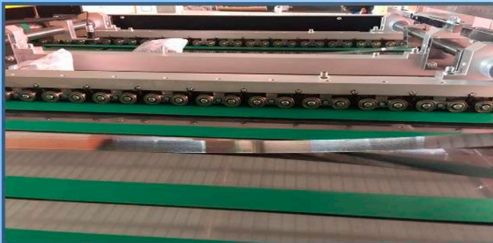
Sistema de alineación de material