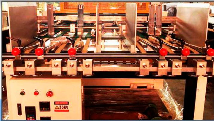
Sección de alimentación