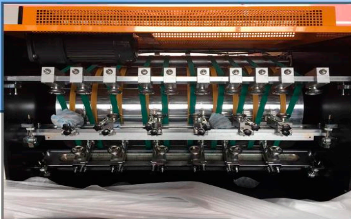
Soportes de acero para cuchillas